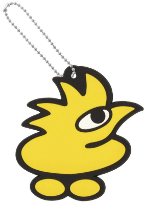
復刻！とり平焼マスコット