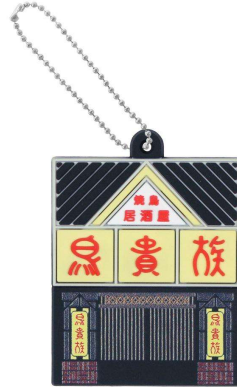
復刻！とりバーグマスコット