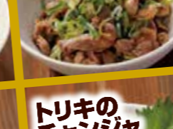
ホルモンねぎ盛 ず ポン酢