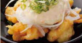
なんばん チキン南蛮