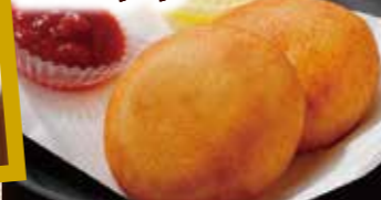
カマンベール コロッケ