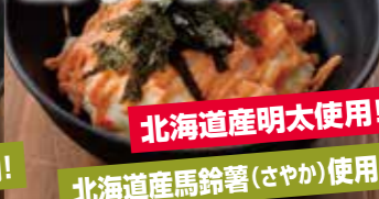
ほっかいどう うみ だいち 北海道 海と大地の ポテトサラダ