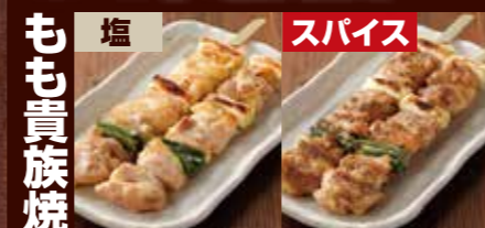
もも貴族焼 塩 スパイス