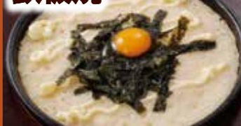
やまいも ふうわり山芋の 鉄板焼