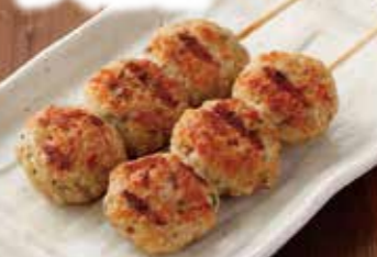
さんかく (ぼんじり) つくね塩