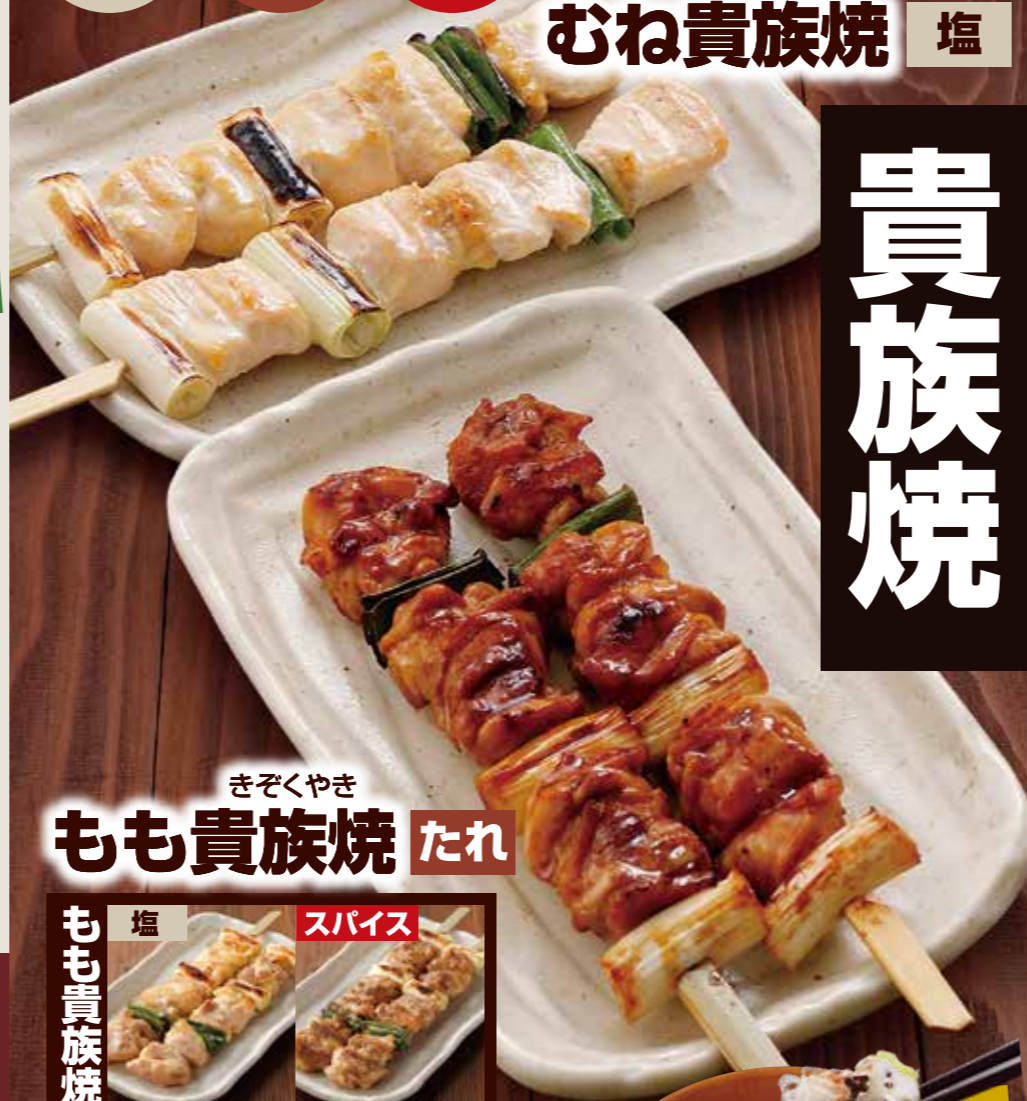
きぞくやき もも貴族焼 たれ