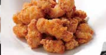
からあげ ひざなんこつ唐揚