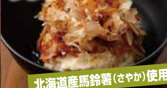
わふう 和風とりポテト サラダ