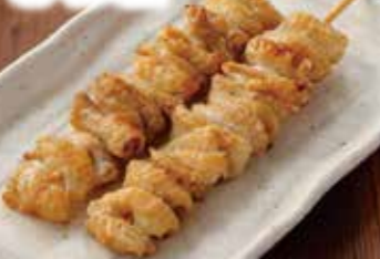
すな 砂すり(砂肝) かわ塩