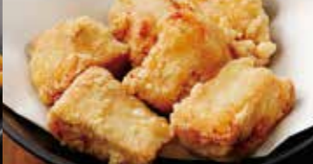
からあげ トリキの唐揚