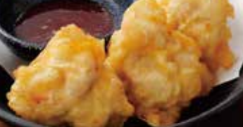
てん とり天・梅肉ソース添え-