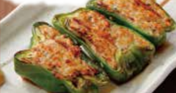
にくづめ ピーマン肉詰 -ポン酢味-