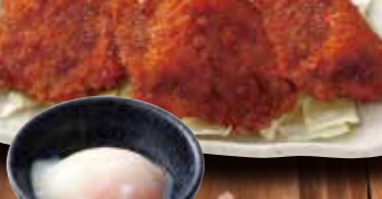
とり 鳥たれかつ丼の頭 ~温玉添え~