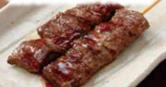
やき ぎゅうくしやき 牛串焼 ※牛脂等、注入加工肉